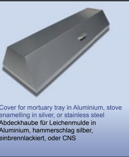
Cover for mortuary tray in Aluminium, stove enamelling in silver, or stainless steel Abdeckhaube für Leichenmulde in Aluminium, hammerschlag silber, einbrennlackiert, oder CNS