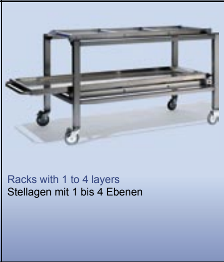
Racks with 1 to 4 layers Stellagen mit 1 bis 4 Ebenen