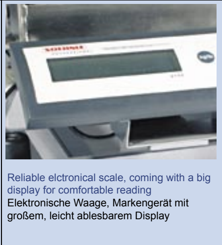
Reliable electronical scale, coming with a big display for comfortable reading Elektronische Waage, Markengerät mit großem, leicht ablesbarem Display