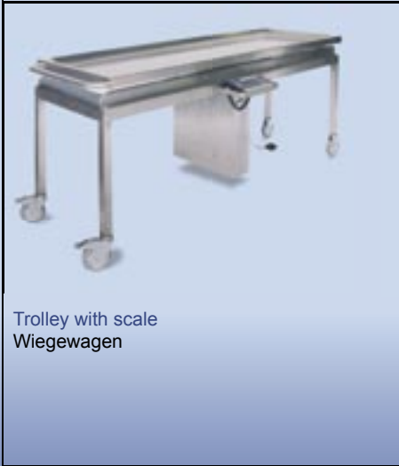
Trolley with scale Wiegewagen