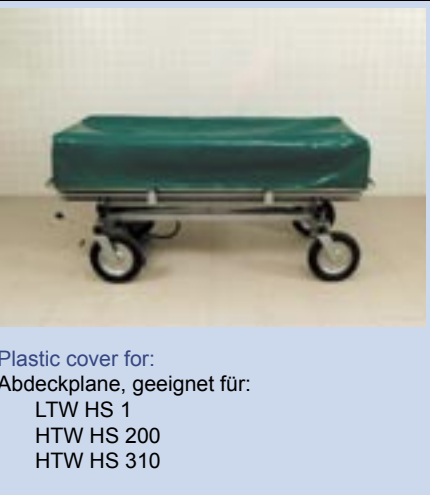
Plastic cover for: Abdeckplane, geeignet für: LTW HS 1 HTW HS 200 HTW HS 310