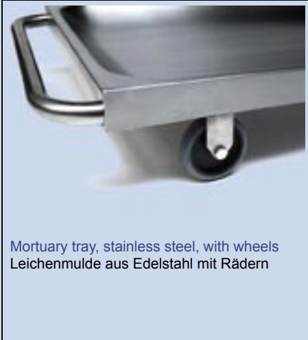
Mortuary tray, stainless steel, with wheels Leichenmulde aus Edelstahl mit Rädern