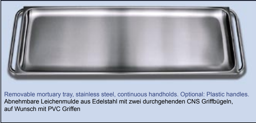
Removable mortuary tray, stainless steel, continuous handholds. Optional: Plastic handles. Abnehmbare Leichenmulde aus Edelstahl mit zwei durchgehenden CNS Griffbügeln, auf Wunsch mit PVC Griffen