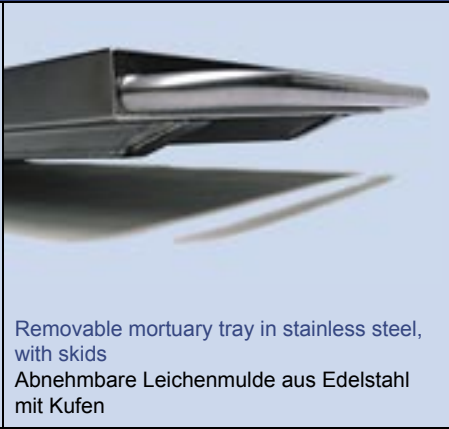
Removable mortuary tray in stainless steel, with skids Abnehmbare Leichenmulde aus Edelstahl mit Kufen