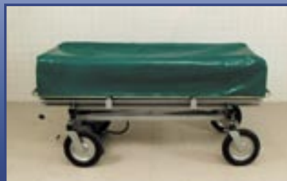
Plastic cover Kunststoff Abdeckplane