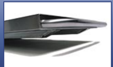
Mortuary tray with skids Leichenmulde mit Kufen