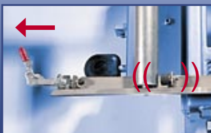
Lockable roller conveyor Arretierbare Rollenauflage