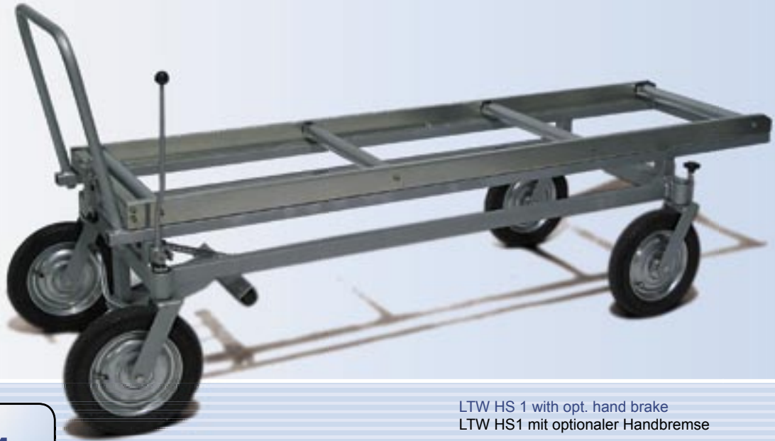
LTW HS 1