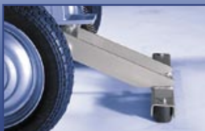
Effective 2 Point braking system Wirkungsvolle Standbremse